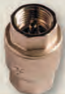
КЛАПАН ЗВОРОТНИЙ латунний муфтовий з латунним штоком