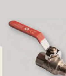
Кран кульовий Derkaliber Grand в-з, ручка-важіль