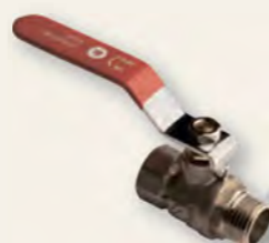
Кран кульовий Derkaliber Kraft в-з, ручка-важіль