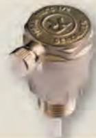
ПОВІТРОВІДВІДНИК з відсікаючим клапаном