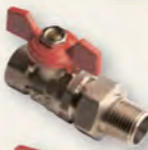
Кран кульовий Derkaliber Kraft, американка