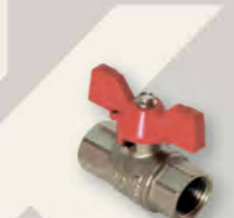
Кран кульовий Derkaliber Grand в-в, ручка-метелик