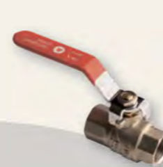
Кран кульовий Derkaliber Grand в-в, ручка-важіль