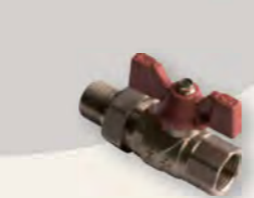
Кран кульовий Derkaliber Grand, американка