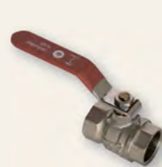
Кран кульовий Derkaliber Kraft в-в, ручка-важіль