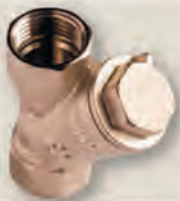
ФІЛЬТР ОСАДОВИЙ латунний муфтовий