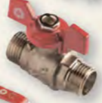
Кран кульовий Derkaliber Kraft з-з, ручка-метелик