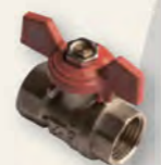
Кран кульовий Derkaliber Kraft в-в, ручка-метелик