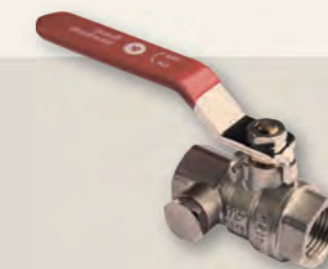
Кран зі спуском