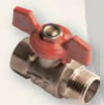
Кран кульовий Derkaliber Kraft в-з, ручка-метелик