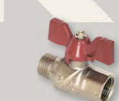
Кран кульовий Derkaliber Grand в-з, ручка-метелик